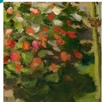
La souricière (détail) - Peinture hollandaise 17e siècle ; DOU Gerrit- Entre 1645 et 1650